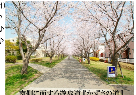
南側に面する遊歩道『かずさの道』