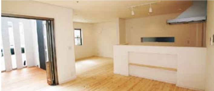
リビングとダイニングは中庭のようなウッドデッキでつながり全開口サッシを開放するとワンフロアの広々空間に。外観のアクセントにもなっているシュードでプライバシーにも配慮されています。