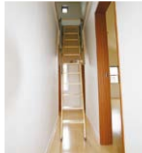
屋根の勾配を活かしロフトを設置。