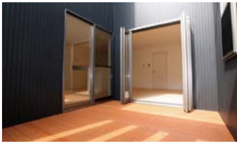
リビングからつながるウッドデッキは昼寝や読書などゆっくり自由時間を楽しめる。