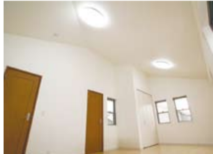
将来の家族構成の変化によってフレキシブルに対応できる間取をご提案。将来の改築や増築にもコストが抑えられるように構造躯体を設計する目には見えませんが心づもりもされているそう。