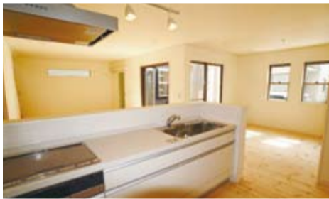
対面キッチンは家族の顔をみながらコミュニケーションで会話はあつむ。