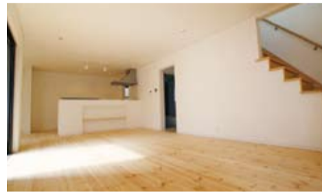
あたたかい陽だまりに無垢の香りが部屋いっぱいに広がるLDK。