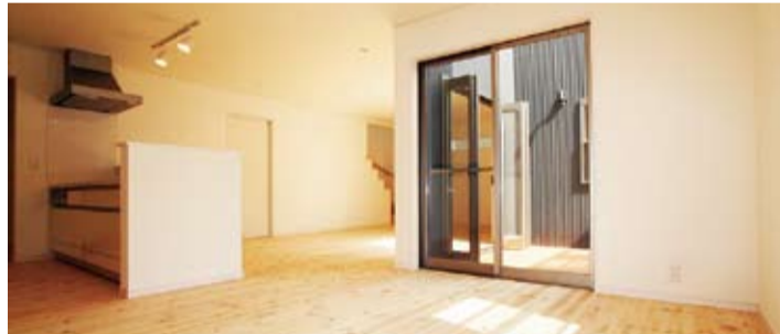
建坪約32坪の層二階でもウッドデッキをリビングの一部としてホームパーティも出来る広い空間が生まれる。